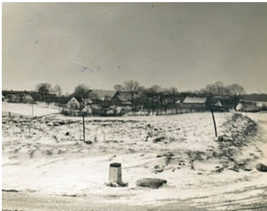
Ordrup landsby set fra Ringstedvej ved vintertide