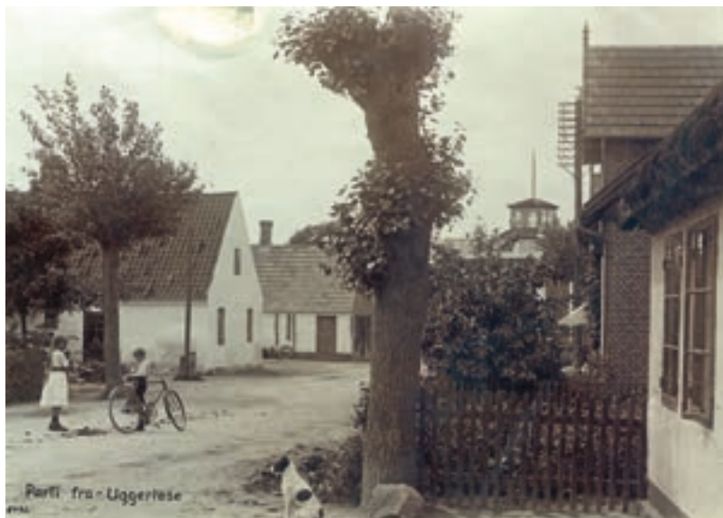
Parti fra Hovedgaden i Ugerløse.