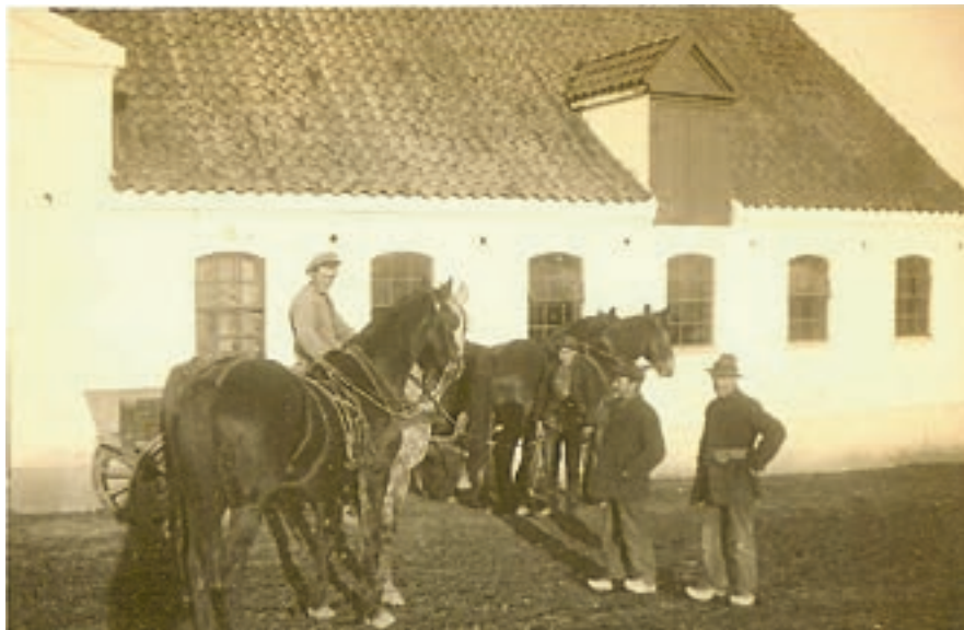
Kørsel med mergel på Højvang i Skimmede