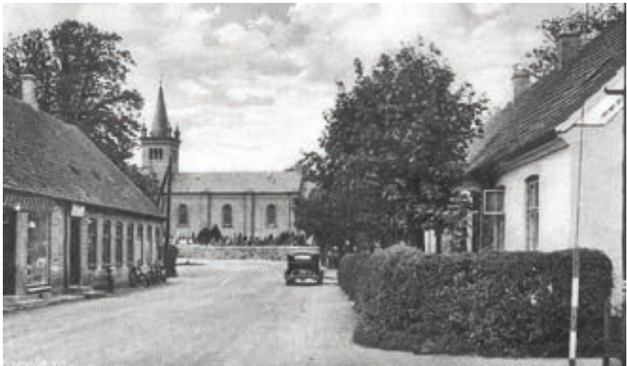
Ugerløse Kirke med Brugsforeningen t.v. og Kroggården t.h.

Ugerløse sogn var indtil 18. maj 1883 anneks sogn til St. Tåstrup sogn og var ligeledes i kommune-fællesskab med St. Tåstrup. Ved kgl. resolution blev Ugerløse præstekald pr. denne dato oprettet som selvstændigt præsteembe-