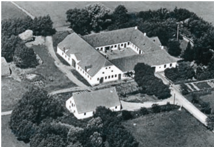
Luftfoto af Højvang, Hjortholmvej 119, Skimmede

Malkekonen kom to gange om dagen og malkede køerne. Det var også hende, der vaskede jungerne. Hun kom ind i køkkenet og hentede 2 kedler kogende vand til at skolde jungerne med til sidst, hvorefter de blev stillet på hovedet ovre på jungebænken ved døren til kostalden, parat til næste aftenmalkning. Mælken blev også siet gennem en rigtig stor si. Den næste morgen kl. 6, eller måske før, kom malkekonen igen og gentog malkningen. Om vinteren kunne det være dejligt at komme ind i en varm kostald for hende. Mælkeemanden kom og hentede vores mælk om morgenen og kør-