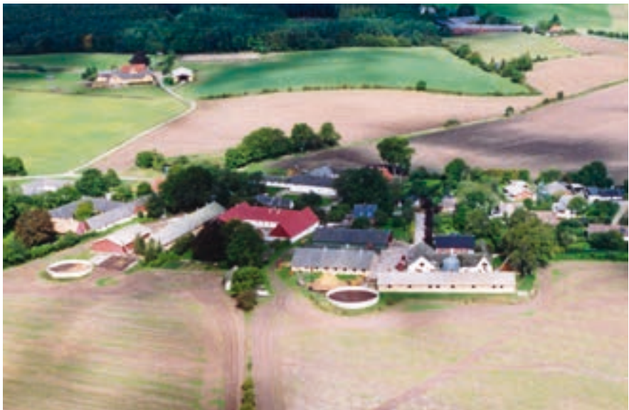
Ordrup, set fra luften. (Fot. Mogens Stjernqvist, 1992)

Selvom der er bygget lidt nye huse i området tilbage i 60'erne og 70'erne, er der også revet enkelte gamle huse ned. Oppe ved Ringstedvej lå engang en smedje, og