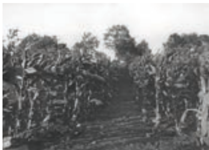
Tobaksmark ved gården i Skimmede. (Dat. 1940'erne)

også klippes, køres hjem og sorteres hjemme i stalden. Herefter blev de solgt til Schellerup i Holbæk til kurvebinding.