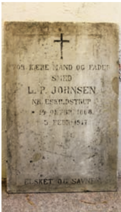
Gravstenen, der blev fundet i en kælder på Norddjurs