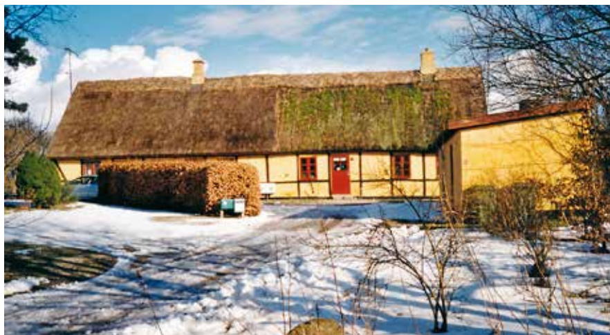
Forvaltergården / Bondegården / Røverborgen, Kvarmløsevej 68. (Foto: Vivi Lausen, 2003).