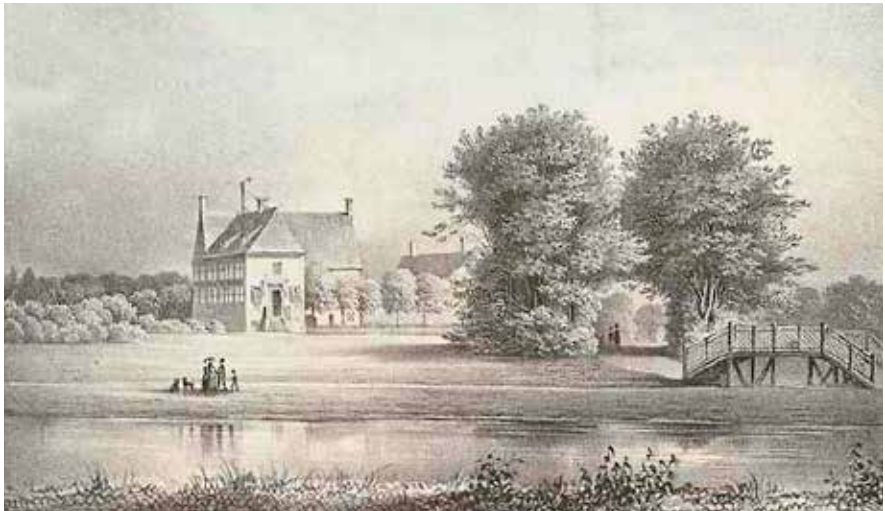
Aastrup Gods 1844