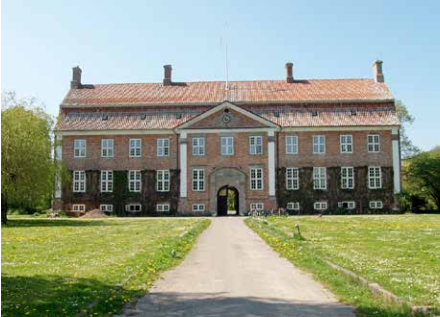
Hovedbygningen på Svanholm Gods.

Torsdag d. 6. maj 2017 besøger Lokalhistorisk Forening for Tølløse Egnen Svanholm Gods. Vi mødes kl. 11.00 ved Cafébutikken, Svanholm Gods 16 A, 4050 Skibby.