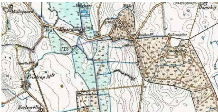
Kort 1845-1899 (Kort- og Matrikelstyrelsen).

Turen til København var noget af en udfordring. Som det ses på kortet fra 1845, var Elverdamsmøllen placeret i et uvejsomt terræn omgivet af store vådområder og en stejl bakke, der svingede ind i Broskoven. Det har været et meget vanskeligt område at passere. Dyr og mennesker har kæmpet sig op ad den stejle bakke fra det sumpede område med flere heste foran vognen eller diligencen. Der var også landevejsrøvere i området. Kroen og møllen lå ved et gammelt overgangssted over Elverdamsåen og var en del af postruten mellem København og Kalundborg. Kromanden havde fra 1735 kongeligt privilegium til at drive kro samt ret til ølbrygning og brændevinsbrænding. Bønderne kom til møllen for at få malet deres korn og blev, mens de ventede, beværtet med