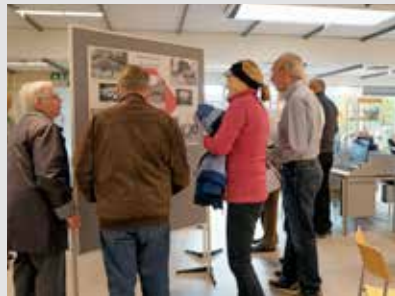
Gæster på Arkivernes Dag 2015.

Sæt allerede nu kryds i kalenderen til en forhåbentlig hyggelig dag, hvor Lokalarkivet – udover før & nu-billeder – byder på kaffe og kage, en konkurrence samt tid til snak.