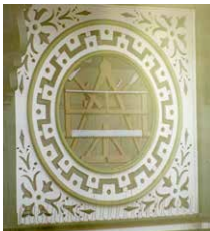
Håndværkersymbol.